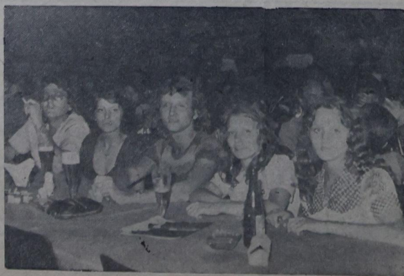
O colonista em um banquete com seus familiares

UM GRITO PARADO NO AR. Confirmada para hoje, a estréia no Teatro Princesa Izabel de "Um Grito Parado No Ar", do Guarnieiri. Essa encenação ficou em cartaz durante vários meses na paulicéia e agora aqui no Rio deverá repetir a dose. Vamos lá sim. ★ Mais uma vez recomendo assistam logo a "Melhor" e mais bem montada peça teatral de 1973 "O Homem de La Mancha no Teatro João Caetano. Preços populares, apenas 5 cruzas. Bibi Ferreira, meu Deus, que espetáculo! Ela canta, representa, fala, dramatiza, é um show! A gente sente a vibração dessa que é a maior atriz da terra verde-amarela, quando no papel de Dulcinéia (Aldonza) transporta o público aos tempos idos e mágicos de Miguel de Cervantes, o Dom Quixote de La Mancha. Momento emocionante quando todo elenco canta em uníssona voz: "... Senhor mais um sonho impossível. Lutar onde é fácil ceder. Vencer o inimigo invencível, Nega quando a regra é vender".