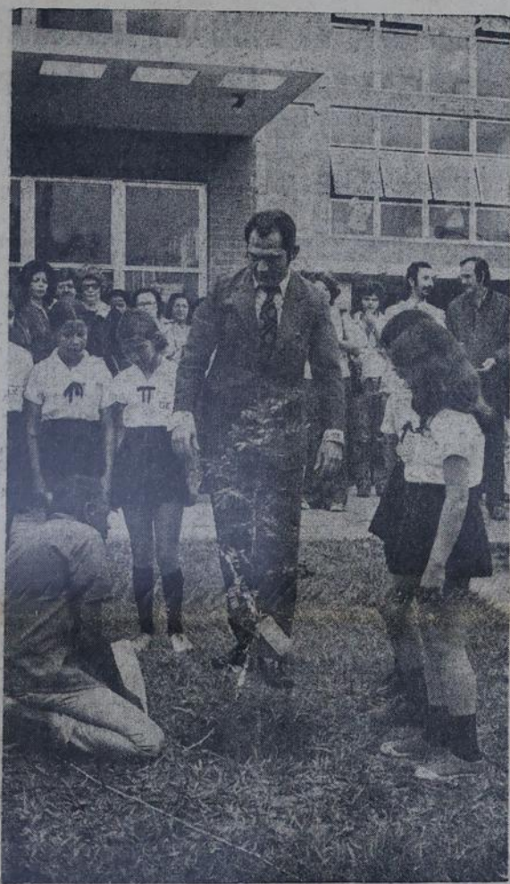
Em Meriti, Denoziro

O Dia da Árvore na Baixada Fluminense recebeu uma série de programações por parte das prefeituras municipais, destacando-se o plantio de mudas por alunos dos colégios, e a apresentação de várias palestras acentuando o valor da árvore na vida moderna, que sofre o problema da poluição pelo instalação de parques industriais e, ainda, o grande número de veículos que circulam atualmente pela região. (Leia na página doze).