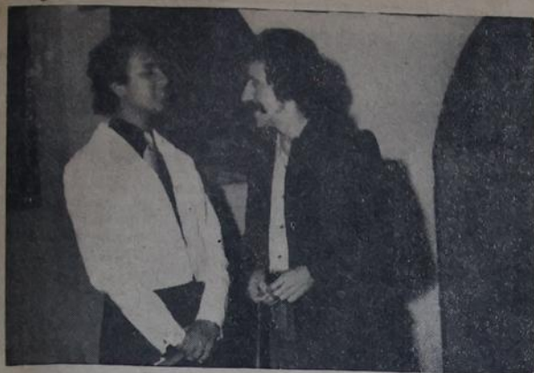
O presidente Altamiro promete uma programação-fóia para o Ideal