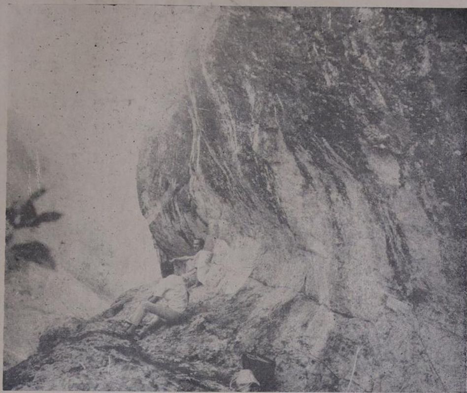
Sentados, os repórteres descansam da longa caminhada que fizeram para chegar à pedra misteriosa.

— O Ginásio Municipal Ex-tem exposição de 28 a 5 de dirigido pela Professora Vera Lúcia Correia de Oliveira, é um dos estabelecimentos de ensino da Baixada que possui todos os requisitos capazes de atender as necessidades da Reforma Educacional, pois além do seu corpo docente da melhor qualidade, possui uma moderna oficina onde os alunos aprendem os mais diversos ofícios e as alunas vão ganhar dentro de poucos dias uma moderna cozinha, com recursos proveniente da Caixa Escolar.